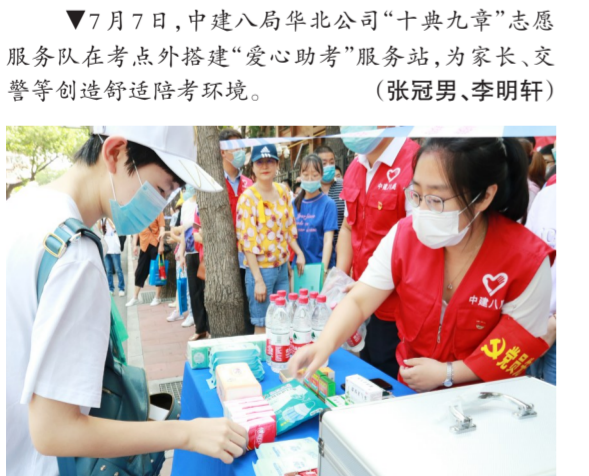
▲7月7日,中建八局华北公司“十典九章”志愿服务队在考点外搭建“爱心助考”服务站,为家长、交警等创造舒适陪考环境。(张冠男、李明轩)