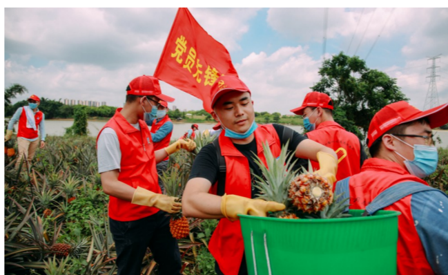
近日,中建四局一公司党委组织35名党员“小红人”到广州花都区爱心助农,仅一小时就摘了125箱凤梨,购入的凤梨将作为职工福利,发放到180名员工手中。(谢敏颖)