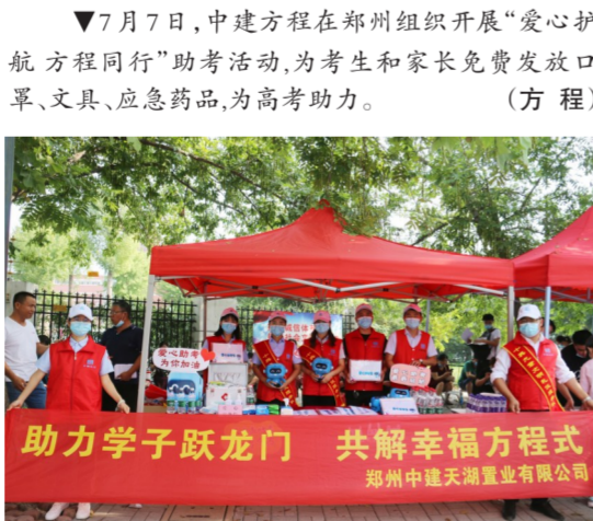
▲7月7日,中建方程在郑州组织开展“爱心护航 方程同行”助考活动,为考生和家长免费发放口罩、文具、应急药品,为高考助力。(方程)