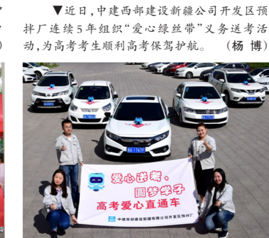
▲近日,中建西部建设新疆公司开发区预拌厂连续5年组织“爱心绿丝带”义务送考活动,为高考考生顺利高考保驾护航。(杨博)