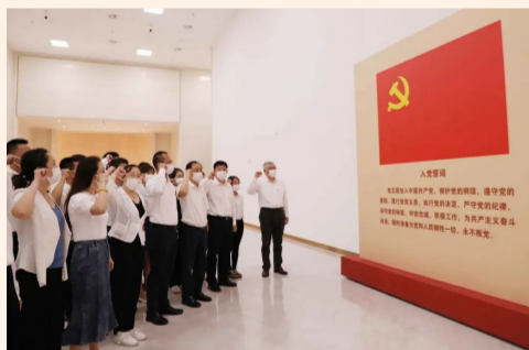
中建设计研究院总部一、二党支部及总部设计一院党支部参观了中国共产党历史展览馆，重温入党誓词，从党的奋斗历史中汲取前进力量。