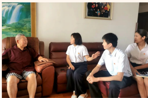
中建装饰所属中外园林陵西分公司党支部拜访原兰州军区空军副参谋长李玉信，聆听老党员讲党课，激励广大党员干部坚定信念，永远跟党走。