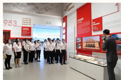
中建产研院党员赴“中国建造之路”企业展厅参观，重温中国建筑40年来奋斗发展历程，感悟中国建筑始终与祖国共奋进、与时代共成长的光辉历程。