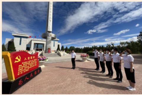
中建六局水利水电公司西北分公司党支部走进宁夏吴忠市盐池县革命历史纪念馆重温入党誓词，向革命烈士敬献花篮，缅怀革命先烈的丰功伟绩。