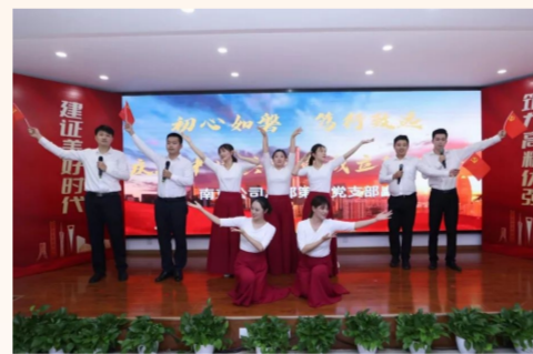
中建安装旗下南京公司组织开展“建证初心 红色传承”主题红歌赛，7个基层党支部精选红色曲目，以悠扬的歌声、动听的旋律，回忆峥嵘岁月，建证美好时代。