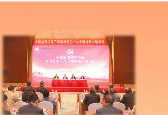
学习党的十九大精神集中培训班

时间见证奋斗者永不停歇的脚步。40年发展历程,是宝贵的知识传承,是厚重的文化积淀。中建党校(中建管理学院)在中建集团党组的坚强领导下,将以40年作为新起点、新方位,不忘初心勇担当、接续奋斗再出发,坚持从严治校、质量立校,在落实“四个面向”、深入实施新时代人才强国战略中,全面提升“主阵地”和“双一流”建设水平,为集团打造行业创新高地、创建世界一流企业提供坚强的智力和人才支撑。