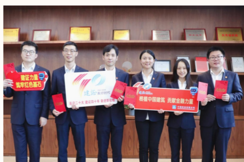
中建财务公司各党支部结合党风廉政建设教育季，积极开展“建证清风”观影及“清风建家”助廉绘画活动，引导广大党员持续发挥先锋模范作用。