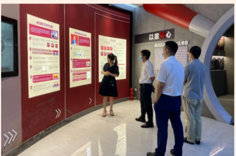
中建东北院福州设计院党支部组织参观福州市仓山区反腐倡廉警示教育基地，学习中国共产党纪律建设历史以及纪检监察工作发展历程。