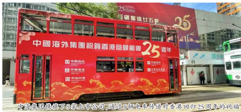
中海集团旗下5家上市公司,通过5辆电车传递对香港回归25周年的祝福

行政长官林郑月娥、香港特别行政区候任行政长官李家超、全国政协副主席梁振英等香港各界人士,多视角讲述香港融入国家发展大局、“一国两制”行稳致远的发展成就。其中,中建集团旗下中海集团董事长颜建国作为驻港中资企业代表,在专访中讲述了中国海外集团在港发展经历、助推香港经济社会发展和“同心抗疫”的事迹,并展望了香港长期繁荣稳定和“一国两制”美好前景。