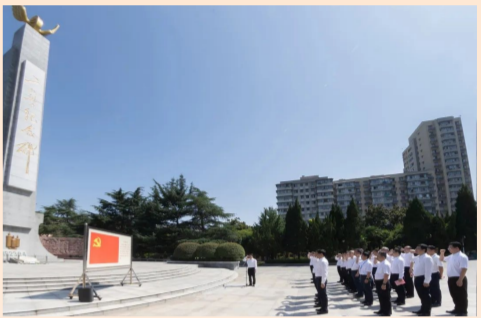
“我志愿加入中国共产党，拥护党的纲领，遵守党的章程……”中建三局总部党员代表赴武汉二七纪念馆参观研学，并在毛泽东亲笔题名的二七烈士纪念碑前重温入党誓词。