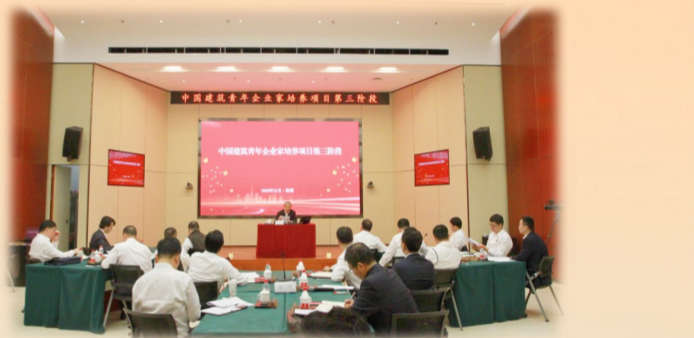
中国建筑青年企业家培养项目第三阶段学习