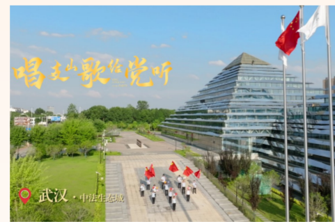
中建科工武汉汉口客运中心项目党支部等7个项目支部以“同唱一首歌”的形式，在国旗下“唱支山歌给党听”，展现新时代中建人的奋斗精神，为建党101周年献上祝福。