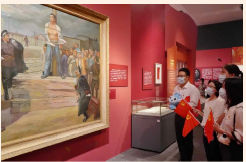
中建发展所属中建生态环境在京党支部组织党员赴国家博物馆参观“人格的力量——中国共产党人的家国情怀”主题展，深刻感悟共产党人的为民初心和家国情怀。