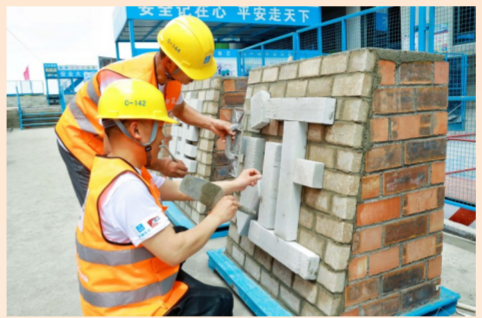
中建二局一公司长沙梦想天悦项目党支部以劳动技能竞赛形式，开展“喜迎二十大 建功新时代”主题党日活动。工人在墙面上砌筑出“喜迎二十大 建证四十年”主题字样。