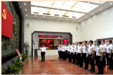
中建国际引导和帮助党员群众上好“大思政课”，国内事业部支部党员参观了苏州革命博物馆，重温入党誓词，接受红色历史的洗礼和熏陶。

在庆祝中国共产党成立101周年之际，中建集团各基层党支部组织开展“喜迎二十大 建功新时代”主题党日活动，将主题党日活动与深入学习贯彻习近平新时代中国特色社会主义思想充分结合，与贯彻落实党的二十大精神深度融合，通过主题党课、专题座谈会、实地研学、现场观摩、红色基石论坛、红色先锋事迹报告会等形式，庆祝中国共产党成立101周年，重温中国共产党百年奋斗的光辉历程和伟大成就，深刻理解中国建筑发展历史。广大党员职工在学习中汲取力量、在感受光辉历程中坚定信仰，以红色精神激发干事创业热情、以实际行动传承红色基因，奋力推动企业高质量发展，以优异成绩迎接党的二十大胜利召开。