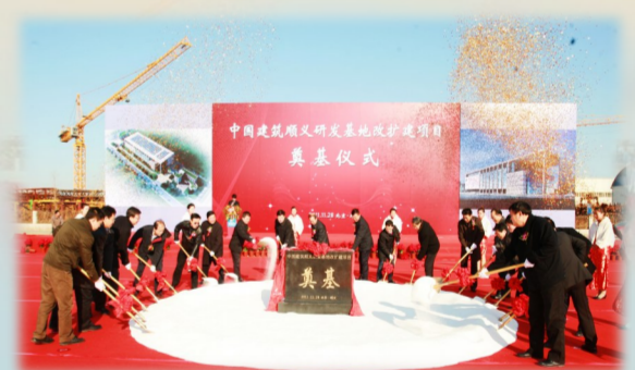
中建技术中心林河研发基地改扩建奠基

中建技术中心将继续坚守初心,聚焦中建集团“一创五强”战略目标,实施“166”战略举措,为集团创建世界一流示范企业凝心聚力,为大国建造贡献科技力量。