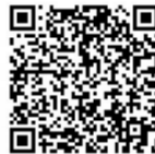
扫码关注更多资讯

紫荆花开,香江潮涌,行而不辍,未来可期。中建集团将继续发挥自身优势,做强做优做大在港业务,积极开展社会公益活动,一起推动香港迈向更加美好的明天。