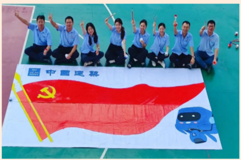
中建七局土木工程公司长沙绿地星城光塔项目党支部党员、入党积极分子及青年职工齐动手，共同绘制巨幅党旗，用行动表达中建员工的爱党之心。