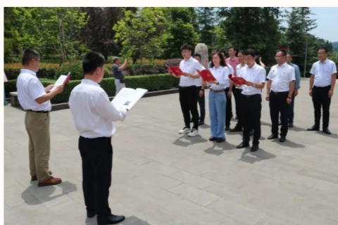
中建长江(西南区域总部)第二党支部全体党员以及入党积极分子以歌唱形式重温入党誓词，让入党誓词入脑入心，督促广大党员干部不忘初心继续前进。