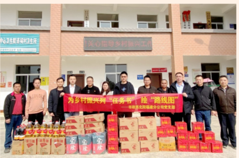
中建市政西北院福建分公司党支部围绕“喜迎二十大 建功新时代”，举办主题党日活动，聚焦长汀县乡村振兴工作，作调研、出规划、助教育，以乡村振兴实效喜迎党的二十大。