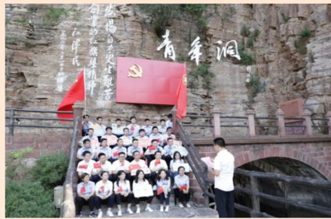
中建一局一公司总部党支部组织党员、青年代表前往安阳市红旗渠红色教育基地接受红色精神洗礼，引导广大党员干部赓续红色血脉，争做时代先锋。