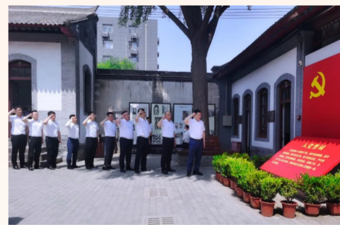
中建港航局西北事业部党支部全体党员、预备党员和入党积极分子前往八路军西安办事处缅怀先烈，重温入党誓词，引导广大党员牢记初心使命，奋力开创企业发展新局面。