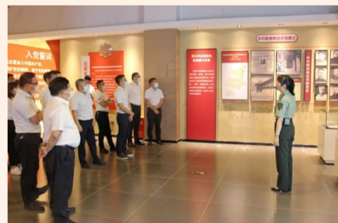
中建方疆新疆老城区公司党支部组织党员参观了延安精神新疆教育基地，沉浸式追寻红色记忆，在感受光辉历程中坚定信仰，以红色精神激发奋进力量。