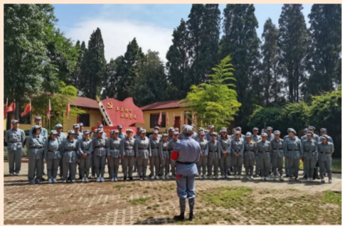
基础部(中建基础)所属云投公司昆明三清高速公路项目党支部赴红军长征柯渡纪念馆进行参观，党员们重走长征路，沿着革命先辈的足迹，重温红色历史。