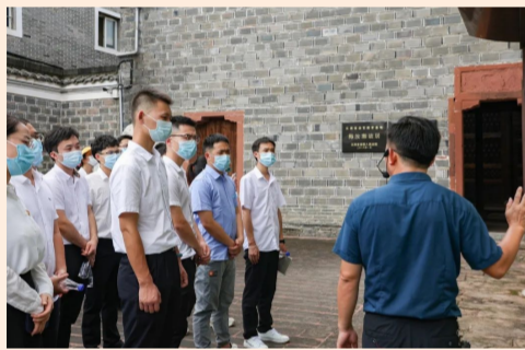
中建四局党员走进法治文化教育基地，了解梅汝璈在东京审判中为中国赢得荣誉和尊严的艰辛历程，激发广大党员干部职工干事创业热情。