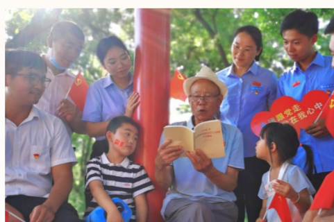
中建丝路(西北区域总部)总承包事业部第一、二、三党支部联合组织事业部干部职工实地观摩牛背梁红色教育基地，重温入党誓词，开展党性教育，接受红色精神洗礼。