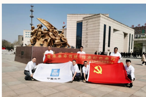
中建北方四平项目党支部组织一线党员职工参观四平战役纪念馆，开展体验式重温四平战役历史全过程，缅怀革命先烈，汲取英烈奋勇前行的精神力量。