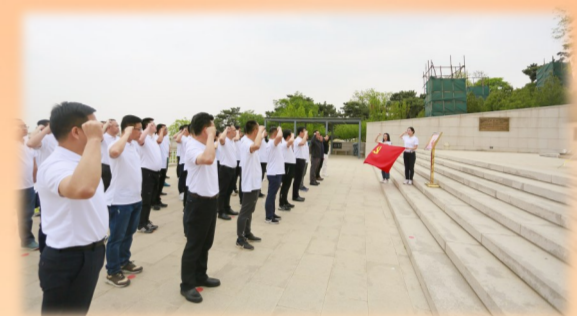
第66期党校班学员重温入党誓词