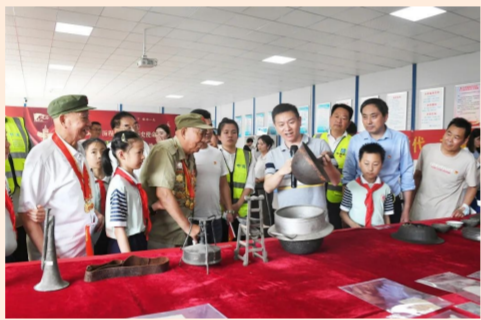
中建五局二公司合肥葛大店幸福城项目党支部联合合肥市新四军历史研究会等单位党组织开展主题党日活动，101位党员群众齐聚一堂，庆祝建党101周年。