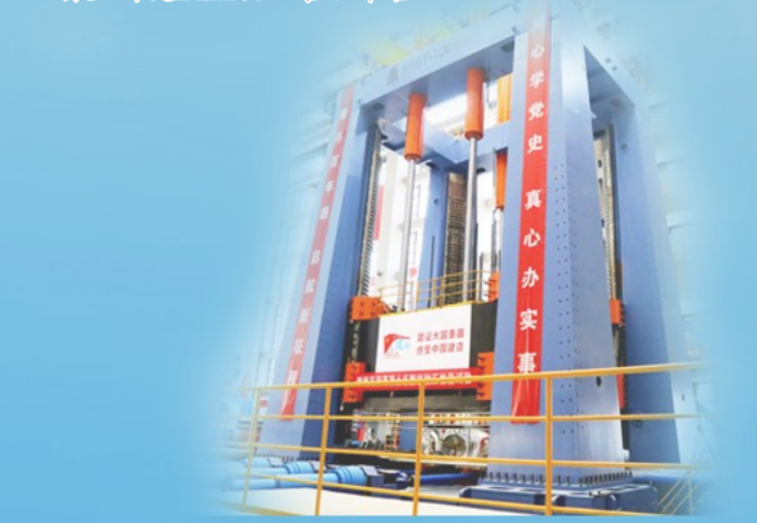
万吨级多功能试验系统