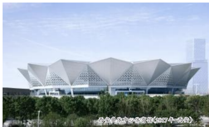
西安奥体中心体育馆(2017年·西安)

1952年，在挺起新中国工业脊梁的东北沃土上，中建东北院因时受命，应运而生。在恢复国民经济、开展各项建设的时代浪潮中，以启山林，上下求索，为共和国工业、国防、现代化建设作出历史性贡献……走过芳华璀璨的70年，中建东北院始终初心如磐，坚定不移服务党和国家事业发展，用一技之长书写爱国志士。