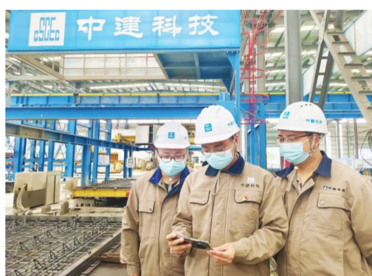
中建科技花溪装配式建筑工厂车间党员带头成立“党的二十大精神学习宣讲小分队”，每天利用业余时间来到车间，以产线工人的视角、接地气的方言，深入浅出地向产线工人宣讲党的二十大精神。