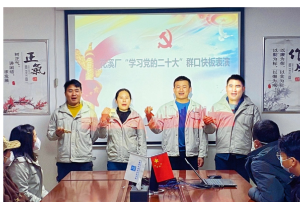
中建西部建设(广东)有限公司花溪厂党支部组织全体党员、青年团员将二十大报告要点汇编成快板词，向厂站员工宣传党的二十大精神。伴随着明快的节奏、整齐的动作、悦耳的声音，理论宣传变得鲜活起来。