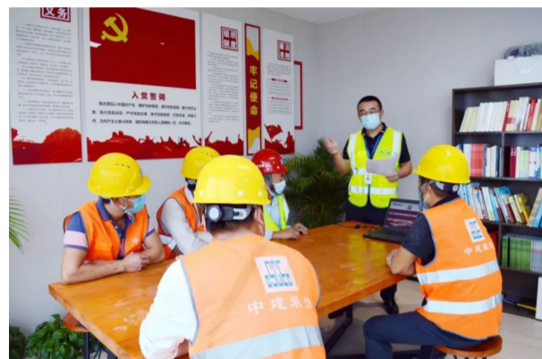
为推动党的二十大精神深入基层，中建装饰所属海外装饰广州设计之都项目党支部组织开展系列“微课堂+微宣讲”活动，邀请一线工友与管理人员一同学习党的二十大精神。