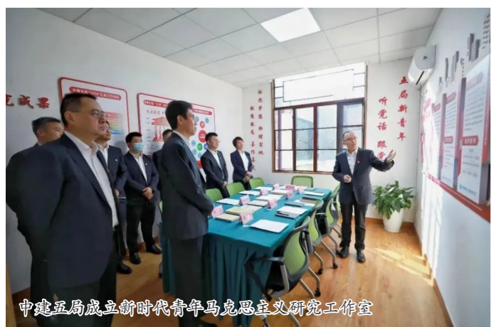
中建五局成立新时代青年马克思主义研究工作室