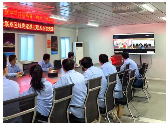
“我们要主动作为，带领项目全体人员学习贯彻党的二十大精神……”中建交通华北公司齐河县学校建设项目党支部书记在学习党的二十大精神专题党委会上带领大家学习报告原文，分享学习心得。