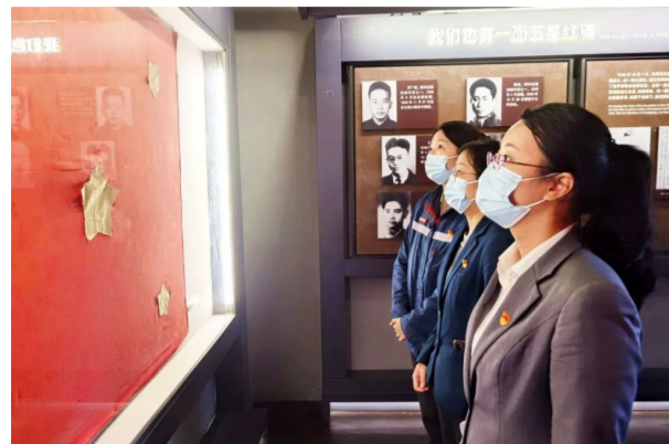
在重庆革命遗址白公馆，重庆中海物业寰宇天下党小组组织一线党员、团员青年和职工群众开展主题党日活动，大家追忆红色历史，缅怀革命英烈，立志将自身理想同祖国的前途紧密连在一起，扎根人民，奉献国家。