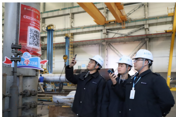
为拓宽学习渠道，中建安装旗下中建五洲利用“装备制造工匠青年学习社”阵地，在制造车间内打造“有声图书角”。通过扫码“一键聆听”，让车间青年员工、生产一线员工零距离学习领悟党的二十大精神。