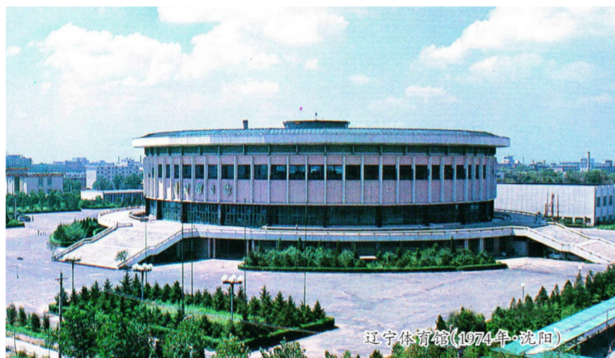
辽宁体育馆(1974年·沈阳)