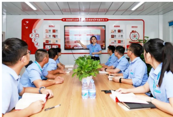
在中建八局华南公司招商银行总部大厦项目的“有声党建活动室”，党员领导班子带头诵读党的二十大报告原文，分享学习心得体会，带领大家进一步深入领会党的二十大精神内涵。