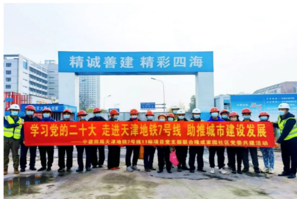
在中建四局轨道交通事业部天津地铁7号线项目，项目党支部携手属地社区联合举办主题党日活动，并邀请十余位市民代表走进建设一线，参加党的二十大报告知识竞赛，促进“地企联学”，达到互比互学、共同提高。