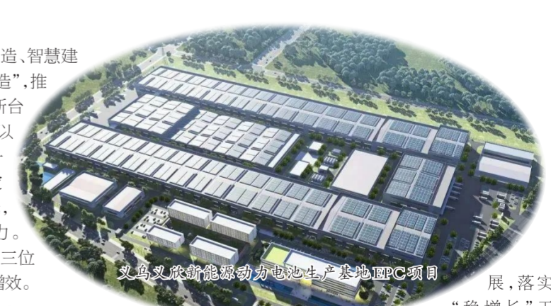
义乌又成新能源动力电池生产基地EPC项目

深化改革创新。“创新才能把握时代,引领时代”。我们要进一步用理论武装头脑,把握时代脉搏,掌握行业动态,深化企业改革发