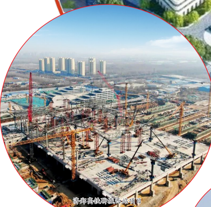
济滨高铁聊城西站项目

起步即冲刺、奋力抢开局,中建八局一公司将秉承“实干为要、价值为纲”,用高质量发展成果为稳增长大局贡献应有之力。