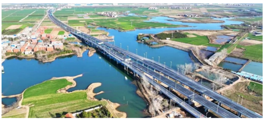
中建三局基建投公司参建的湖北襄阳市首条城市快速路——襄阳襄江大道全线通车。项目位于湖北省襄阳市，被誉为襄阳市的“金腰带”。襄江大道全长约27公里，全程不设一个红绿灯，是襄阳首条真正意义上的城市快速路，实现了城市快速路与国家高速公路网无缝对接，是联系樊城与东津新城中心区最为便捷的交通通道，对构建半小时市区通勤圈、优化“一心四城”空间格局、提升中心城市能级具有重大意义。(李朝琴、聂艺)