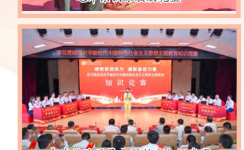
中建丝路开展主题教育知识竞赛

来”青年志愿服务、重访红色地标工程、组织联建共建等方式赓续红色血脉、传承红色基因。中建装饰毛主席纪念馆志愿服务临时党支部为瞻仰群众提供信息咨询、扶弱助残等服务,践行“为主席站岗 为人民服务”的光荣使命;中建东方装饰西北分公司党支部与中外园林陕西分公司党支部赴延安市南泥湾革命旧址开展联学联建,深刻领悟南泥湾精神。