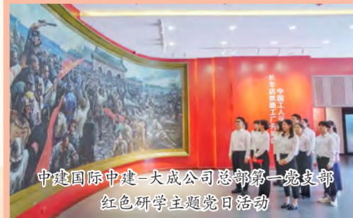
中建国际中建-大成公司总部第一党支部红色研学主题党日活动

中建七局积极组织基层党组织开展“学思想、见行动”主题系列活动,引导广大党员干部职工坚定不移听党话、跟党走。