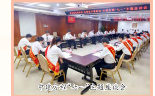
中建方程“七一”主题座谈会

中建科技各基层党组织开展现场观摩、实地研学、重温入党誓词、党员过政治生日等主题党日活动,进一步激发广大党员干部职工干事创业热情。中建科技华南公司党委工作部党支部、纪检监督工作部党支部组织党员青年参观“大潮起珠江——广东改革开放40周年展览”;华北公司山建大绿建实训楼项目党支部组织开展“瞻仰红色遗址 感受红色故事”主题党日活动,共同重温入党誓词。