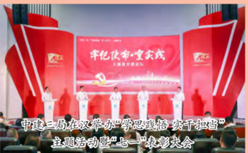
中建二局在汉举办“学思想悟 实干担当”主题党日活动暨“七一”表彰大会

中建西南院(西南区域总部)积极组织各基层党组织开展“学思想、见行动”主题系列活动,