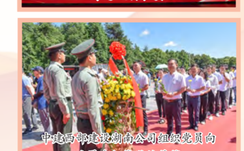
中建西部建设湖南公司组织党员向毛泽东铜像敬献花篮

中建科技各基层党组织开展现场观摩、实地研学、重温入党誓词、党员过政治生日等主题党日活动,进一步激发广大党员干部职工干事创业热情。中建科技华南公司党委工作部党支部、纪检监督工作部党支部组织党员青年参观“大潮起珠江——广东改革开放40周年展览”;华北公司山建大绿建实训楼项目党支部组织开展“瞻仰红色遗址 感受红色故事”主题党日活动,共同重温入党誓词。