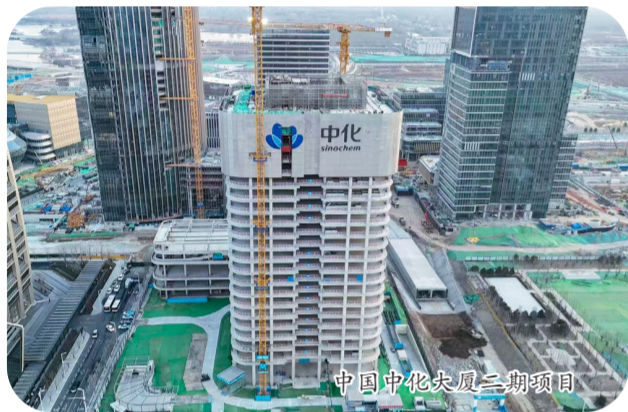
中国华能总部二期项目

在雄安启动区，中建一局、中建三局承建的中国华能总部项目二期工程加速推进中，目前正有序推进地基与基础工程建设。作为雄安新区首批四大央企总部项目之一，项目建成后助力雄安打造国家级能源电力创新高地，推动创新驱动、绿色发展城市建设进程，加速金融、科技等高端要素向雄安新区集聚。