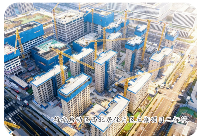
雄安启动区西北居住片区五期项目二标段

在雄安新区启动区，中建交通承建的雄忻景观工程项目主体结构已完工，正推进苗木种植和景观铺装。项目包括中央景观绿带样板段和中央景观绿带城际站明珠湖片区两个区段，全面完工后将形成功能景观兼备、空间自然连续、区段特色鲜明、环境生态优美的城市公园带，助力进一步构建城市绿色空间体系。