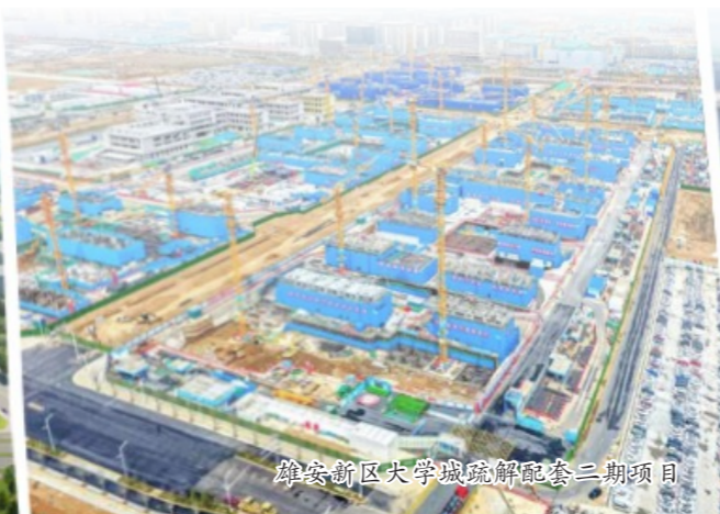
雄安新区大学城疏解配套三期项目