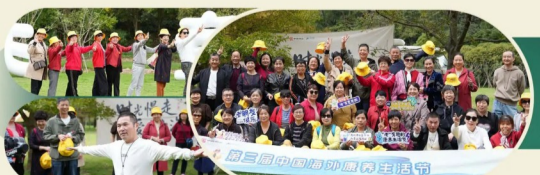
老江东的「老朋友俱乐部」 一起下棋、喝茶、赏花、爬山「老有意思」的新家生活