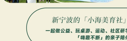
新宁波的「小海美育社」 一起做公益、玩桌游、运动、社区研学「嗨趣不断」的亲子陪伴