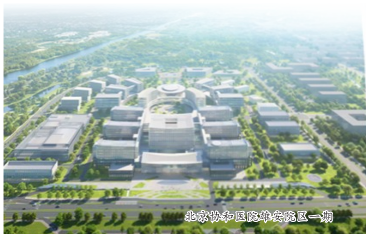
北京协和医院雄安院区一期

耦合，3400余项先进技术汇聚，200余个应用场景落地，让科技从实验室走向生活日常。中建集团发挥全产业链优势，深度参与科创载体建设、智能建造实践、产业生态培育，用高标准和高质量助力雄安新区打造新时代创新高地