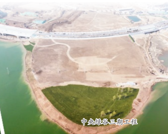
中央绿谷三期工程