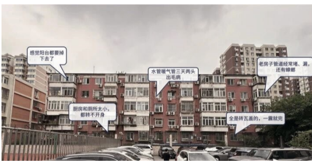
一张老照片 藏着54个心愿 54户人家，54个朴实而急切的心愿——好房子

未来，项目团队将继续以中国建筑“好房子”营造体系为标准，以匠心筑品质，以科技暖民心，为更多城市更新项目贡献力量。