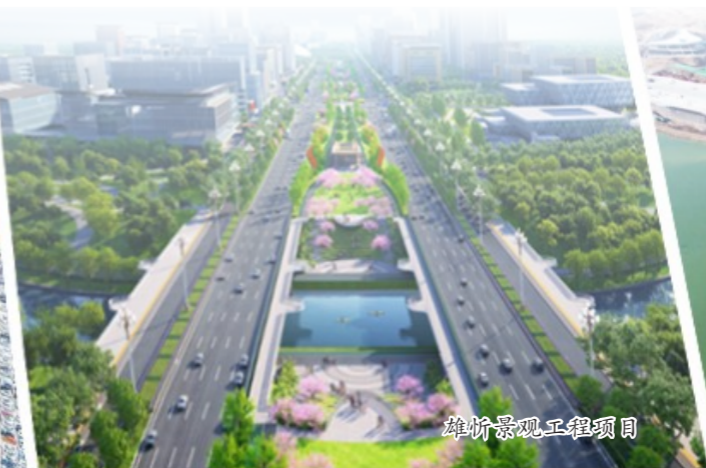
雄忻景观工程项目