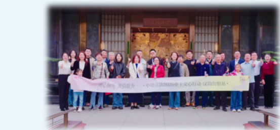
武汉中建壹品·汉韵公馆与业主开展面对面交流

近日,中建新疆建工旗下中建玖序项目受邀参加中国房地产业协会、新疆维吾尔自治区房地产业协会和乌鲁木齐市房地产业协会联合主办的“设计引领高品质住房建设”专题研讨会,全疆11个地州市及兵团7个师住建局代表前来实地观摩,获行业专家与各地代表认可,有效提升“好房子”品牌在新疆区域的影响力。