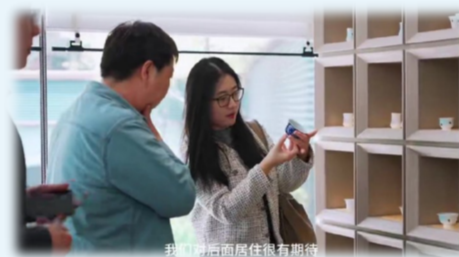
上海中建·玖上琅宸项目“好房子”主题客户体验日

近日,中建八局旗下中环麓岛实景示范区正式开放,完整呈现了中国建筑“好房子”营造体系在上海区域落地成果。该项目采用静音系统、防霉体系、三玻两腔窗以及新风地暖等多项技术与工艺,全面提升居住品质,让产品标准可感知、可检验。项目凭借产品力与持续的实景兑现能力,实现了“三开三捷”,获得市场与客户的广泛认可。其“好房子”营造成果、公园社区打造模式与实景兑现的发展理念五次荣登央视,被主流媒体广泛报道,为行业提供了可借鉴的上海实践样本。