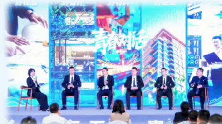
中建壹品海宸元境项目五四青年节主题文明实践活动

中建西南院中建·匠宸元启作为首批四川省好住房三星级项目案例、成都市成华区首个“好住房”三星级双料认证项目,以“好房子”沉浸式展厅为载体,持续发挥常态化品牌传播与行业交流阵地作用。自2026年1月开放以来,累计接待四川省房地产业协会、多省市住建系统、知名房企及高校等考察团超4600人次。特邀《四川省好住房设计导则》主编、中建西南院总建筑师开展现场深度讲解,向行业及公众展示中建·匠宸元启项目实践成效。同时,联动新华网、人民网、四川电视台等中央及省市主流媒体,以及属地有影响力的自媒体,发布报道共计6000余条,全网曝光量突破800万次,以“现场观摩+专家解读+媒体矩阵”的多层次传播模式,全方位展现了中国建筑“好房子”营造体系的实践成果。