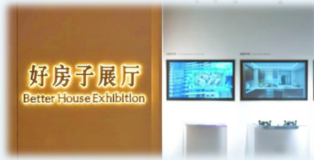
成都中建·匠宸元启展厅

近日,中建七局旗下中建·中环铂樾项目紧扣中国建筑“好房子”营造体系建设要求,依托2026年全国建筑产业职工创新交流大会暨长三角区域“项目党群一体化”活动,启动“好房子”建设劳动竞赛,开展体系宣讲、现场观摩、标准发布、媒体传播一体化传播活动。