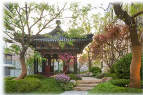
中海·安澜北京项目

近期,中国房地产业协会与河北工业大学一行到中建六局旗下中建·理想城等项目实地调研“好房子”建设工作,中建六局地产公司系统介绍了中国建筑“好房子”营造体系的方法论框架、核心要求及受控项目推进落实情况。