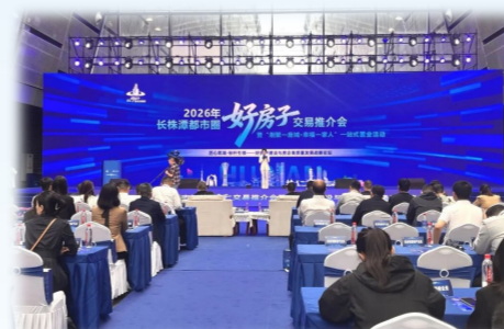
长沙中建·翡翠天序登上长株潭“好房子”推介会