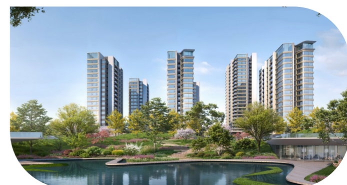
上海中环麓岛实景示范区