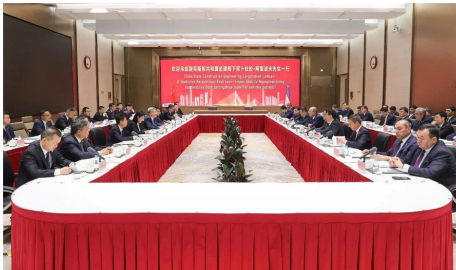
基础设施、民生住房、水利设施、综合体开发、生态修复、清洁能源等领域重点项目建设，

本报讯（通讯员企文、班厅、海外、国吉）5月7日，中建集团董事长郑学选在集团总部与来访的乌兹别克斯坦总理阿里波夫举行会谈，共同见证双方签署重点项目合作协议。乌兹别克斯坦政府有关部委机构、驻华使馆、企业有关负责人；中国驻乌兹别克斯坦大使于骏；中建集团副总经理吴爱国，中建股份助理总裁田卫国等参加会议。